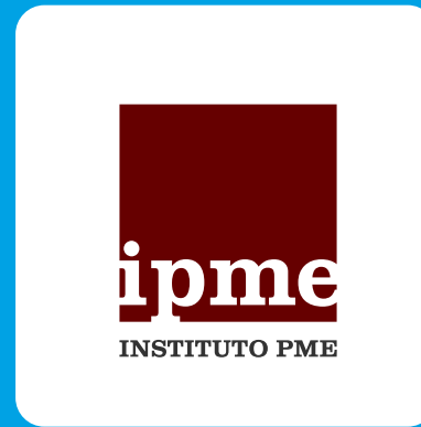
IPME – Instituto PME